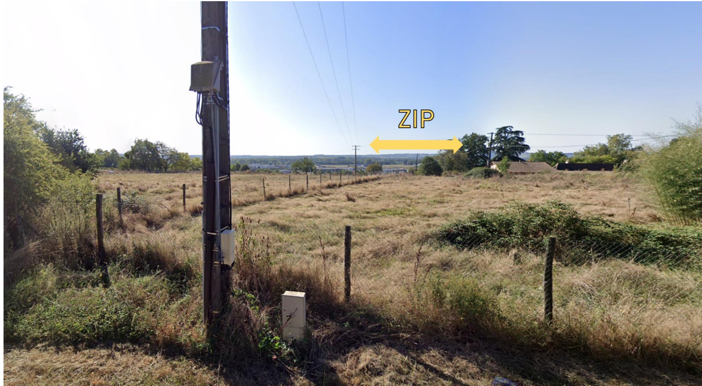
Figure 1 – Vue 1 sur la ZIP depuis la route des Galinoux au nord

Le relief, les éléments du paysage et le centre commercial masquent totalement la zone d'étude.