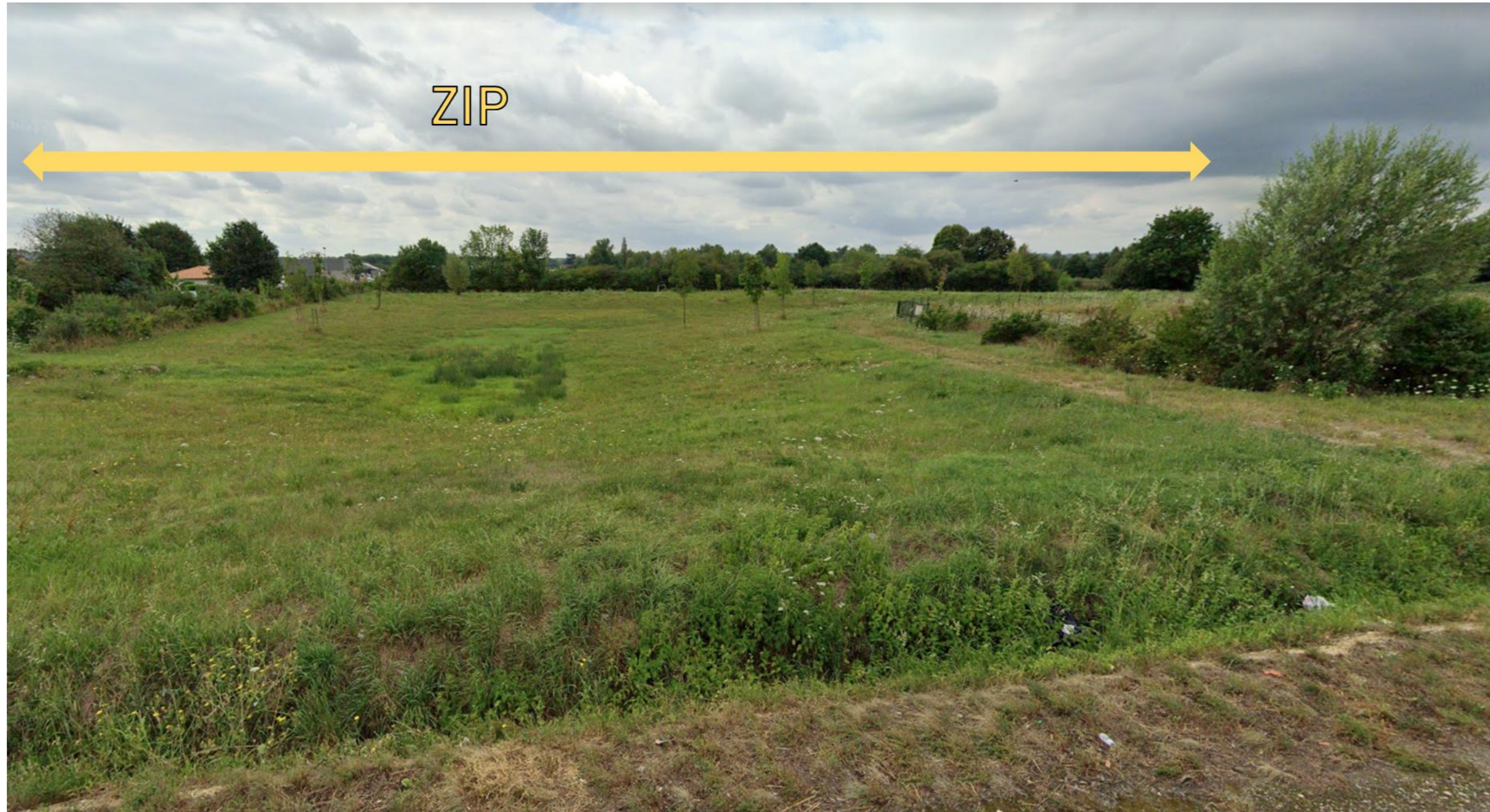
Figure 2 - Vue 2 sur la ZIP depuis la D32 au nord

Le surplombs de la voie ferrée et la végétation éparses forment un masque paysager.